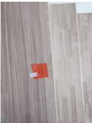
5. รอยจบลามิเนตบนบันไดชั้นบนสุดไม่สนิท