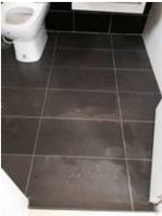
2. ทำความสะอาดพื้นกระเบื้อง