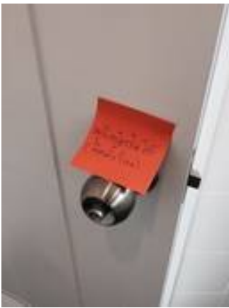
5. ลูกบิดล็อกไม่ได้ (ติดตั้งใหม่)