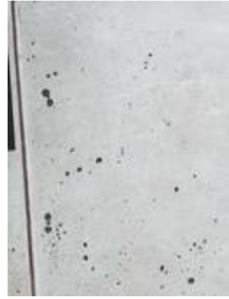
6. เก็บสี ขัดพื้น เก็บงานสีหยุดโรงรถ