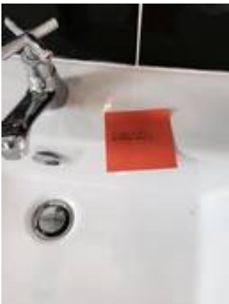
3. อ่างล้างหน้ารั่วซึม