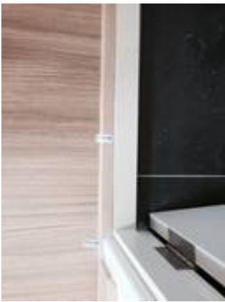
9. เก็บงานขานแนวรอยขบลามิเนตหน้าห้องน้ำ