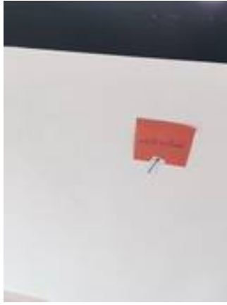
4. ผนังมีรอยดินสอ (ทำความสะอาด)