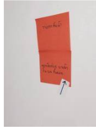
น้ำขัง ตรวจสอบเช็คท่อระบายน้ำชั้นบนทั้งหมด