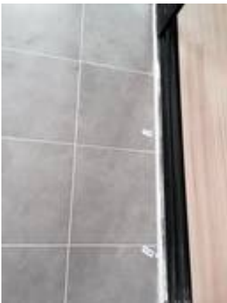
13. กระเบื้องปูไม่เสมอกัน (ระเบียงห้องนอนใหญ่)