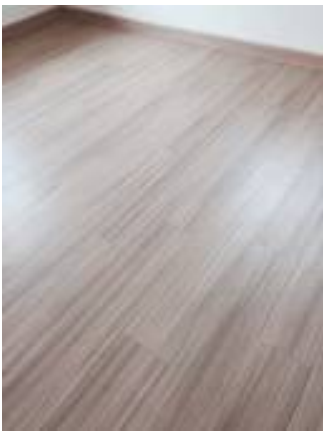
3. ทำความสะอาดพื้นลามิเนต