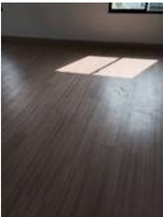
7. ทำความสะอาดพื้นลามิเนต