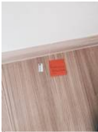
6. พื้นลามิเนตยวบ (แถวๆประตูห้องน้ำ)