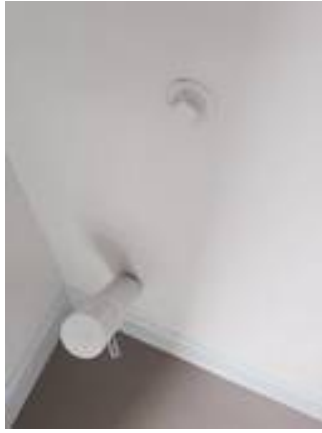
2. เก็บงานสีท่อ