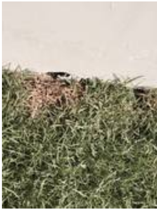
9. งานผนังปูนแตก