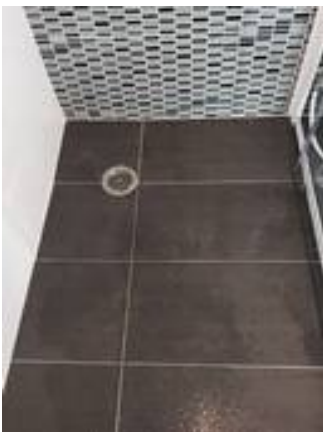
6. ขาแนวพื้นห้องอาบน้ำใหม่