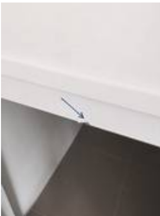
5. วังกบปิ่น(เปลี่ยนใหม่)