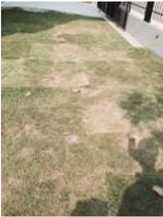
7. ซ่อมแซมหญ้า ปลูกรูหญ้า