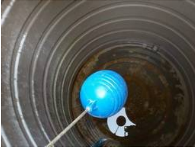
19. ทำความสะอาดแทงก์น้ำ