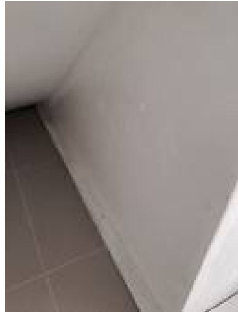
4. เก็บสิ่งต่าง ๆ ที่เพดานห้องได้บันได