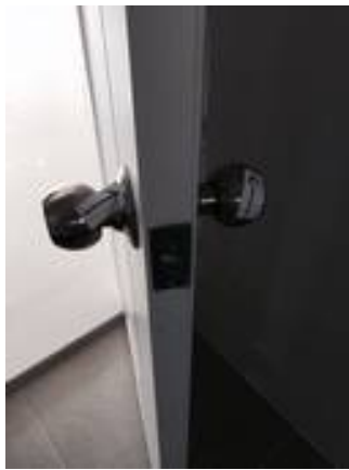
3. ลูกบิดเป็นคราบ (เปลี่ยนลูกบิดใหม่)