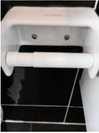
4. น๊อตบริเวณที่ใส่ทิวชูขึ้นสนิม