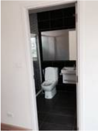
1. นี้อุตบานพับประตูชั้นไม้สนิท