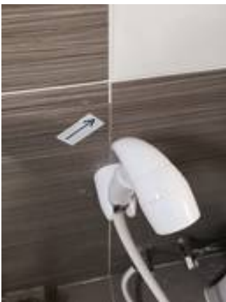
7. ขาแนวกระเบื้องผนัง (บางจุด)