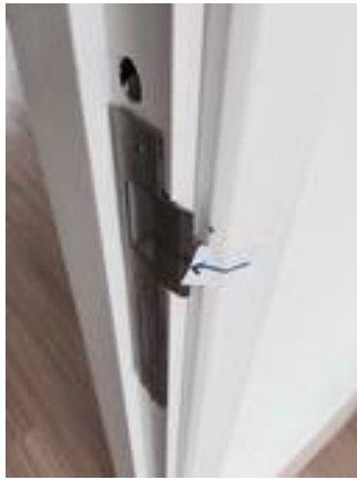
3. จุกประตูดุหาย/อุปกรณ์ขันสนิม