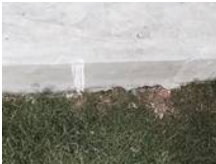
13. เก็บงานขอบปูน (ลานจอดรถ)