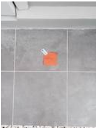
10. ระเบียบโพรง (บริเวณประตูหลังบ้าน)