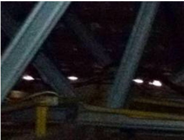
ปิดกล่องสายไฟใต้หลังคาให้เรียบร้อย