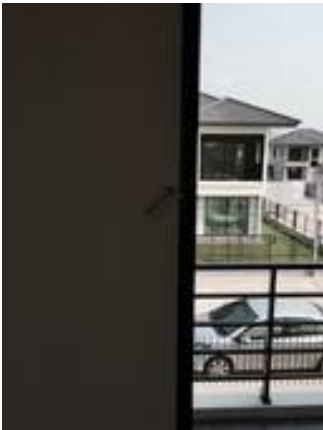
12. เก็บสีตามขอบเฟรม