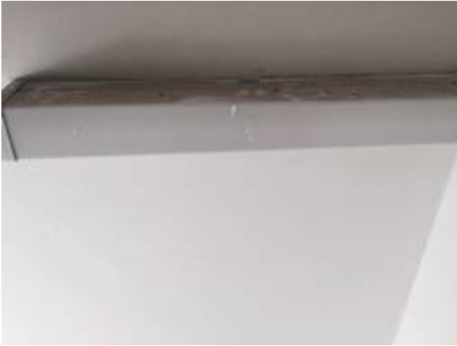
3. ทำความสะอาดหลอดไฟ