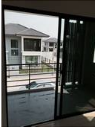
11. เก็บงานตามขอบเฟรมหน้าต่าง (ทุกบาน ในบ้าน)(ขอบไม่เรียบ)