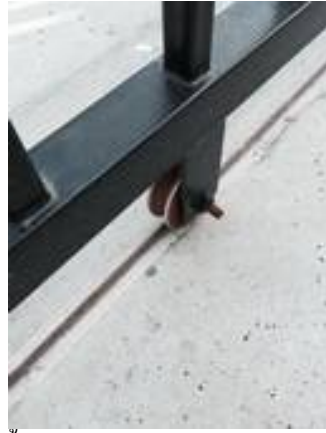
3. เก็บสีประตูรั้ว (กันสนิม)/ รางเลื่อนและล้อขึ้นสนิม/ประตูเปิดปิดเสียงดังและฝืด