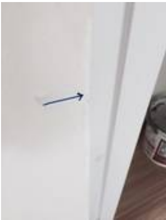
4. เก็บงานสีประตูใหม่ (บริเวณขอบบานประตู)