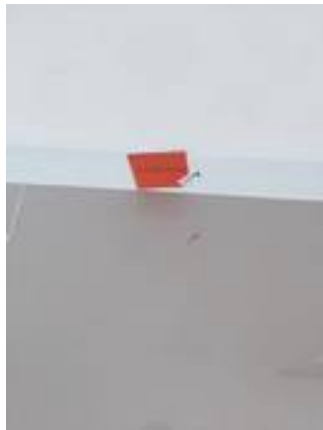
2. เก็บงานสีบัวโดยรอบ และทำความสะอาด