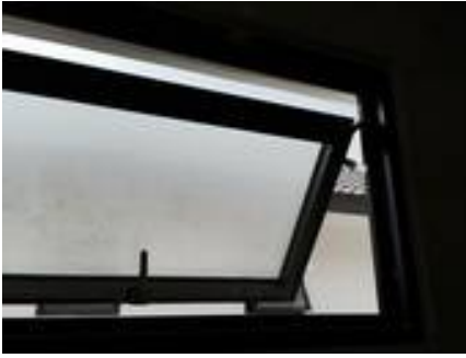
7. เก็บงานขอบเฟรมบานกระทุ้ง (เดอะลี)