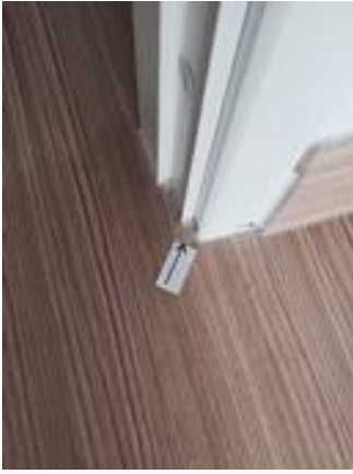
5. ทำความสะอาดพื้น และเก็บงานซึลิ โคนตรงหน้าประตู