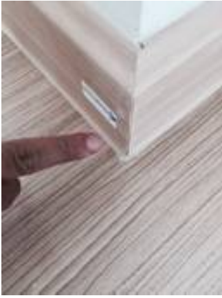
8. เก็บงานบัว