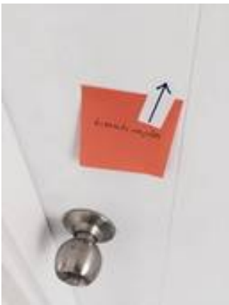
6. ทำความสะอาดลูกบิด