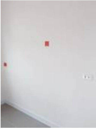
4. ผนังไม่เรียบ/ทาสีผนังทั้งหมด