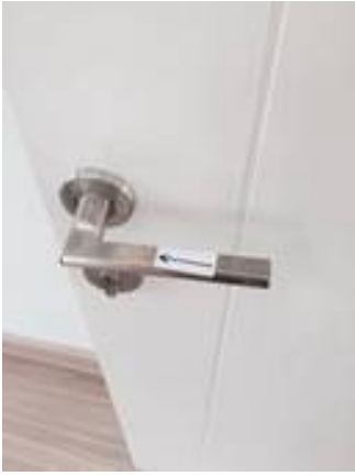
1. มือจับเป็นคราบ