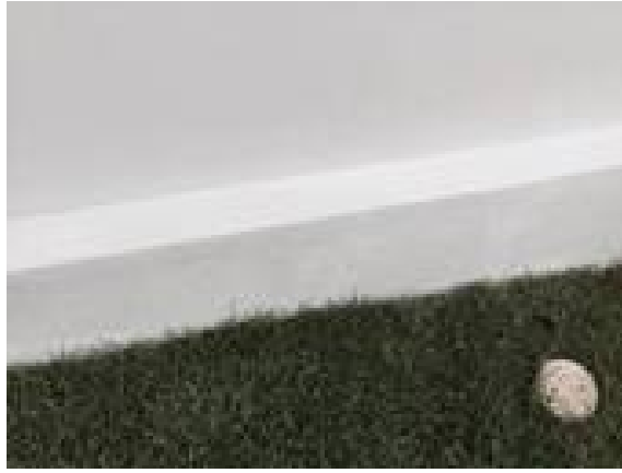
11. เก็บสึเลอะท่อ pvc / ผนังฝั่งซ้ายต่าง