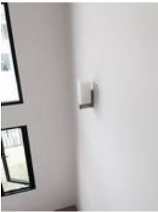
4. โคมไฟบริเวณเหล็กเป็นคราบ