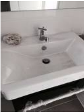
4. ก๊อกน้ำ น้ำไหลไม่แรง เช็คอุปกรณ์ เช็กระบบท่อ