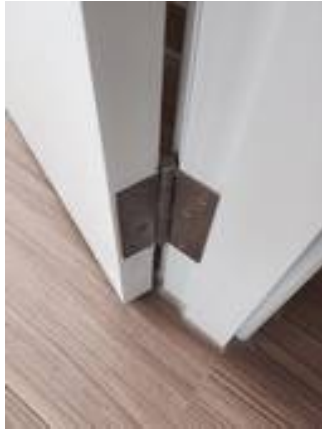
2. น๊อตขันไม้สนิท