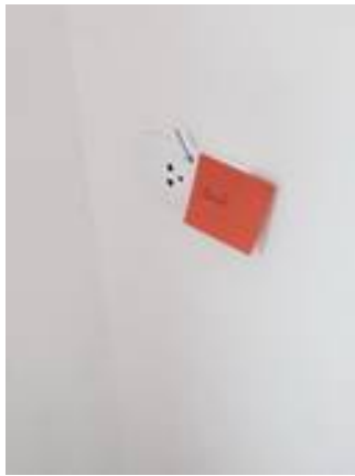
3. ปลั๊กเดอะตี