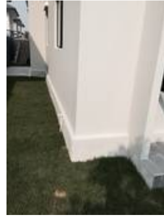
8. สีภายนอกต่าง (ทาใหม่) เก็บงานสีดินผนัง