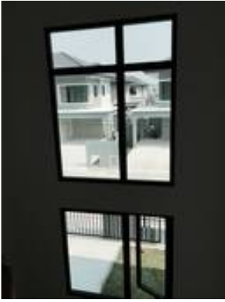
3. ทำความสะอาดบานกระทุ้ง