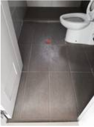
2. ขาแนวพื้นห้องน้ำใหม่