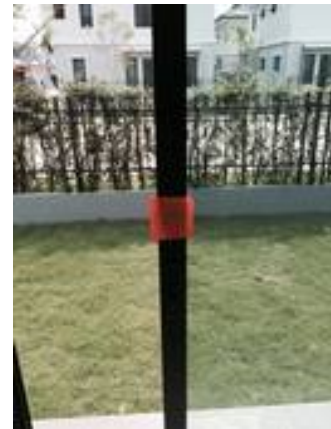
3. เช็ดประตูบานเลื่อน ตัวล็อกเสียทั้ง 2 ข้าง หน้าบ้านและด้านข้าง