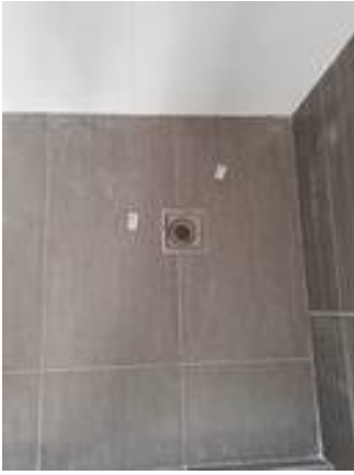
5. กระจกโพรง (ห้องอาบน้ำ)