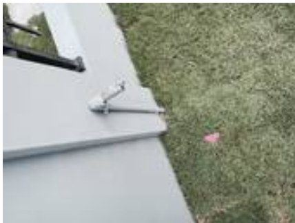
14. ก๊อกรั่วรั้ว และติดเอียง (กำแพงโรงรถฝั่งซ้าย)