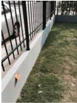
4. เก็บสีตลอดแนวดินกำแพงทั้งหมด