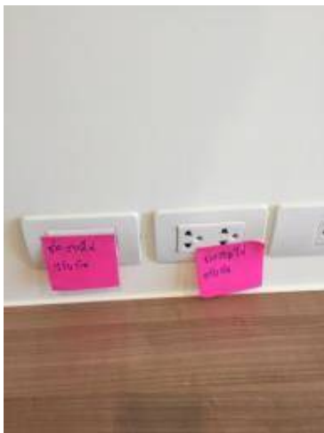
7 ต่อสายไฟกลับกัน