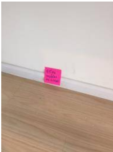
3เช็ดโคนขอบบัวโดยรอบทั้งหมด