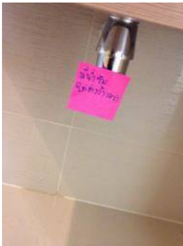
2 มีน้ำซึม ใต้อ่างล้างหน้า