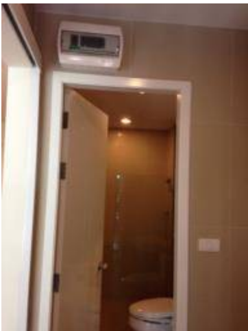
รายการห้องน้ำ