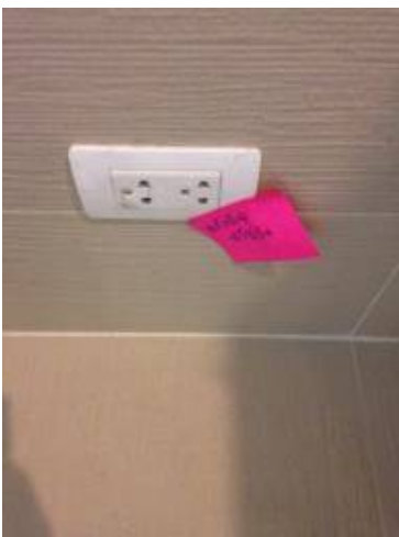
2 ปลั๊กไฟสลับด้าน