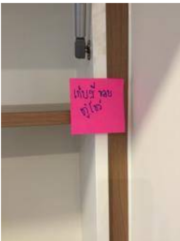
10เก็บสีขอบตู้โชว์