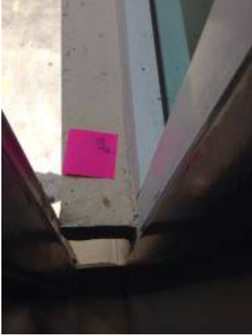
3 เก็บสีด้านนอก