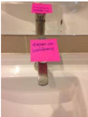
3 ทำความสะอาดก๊อกน้ำเป็นคราบ