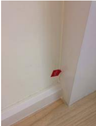
รายการห้องครัว