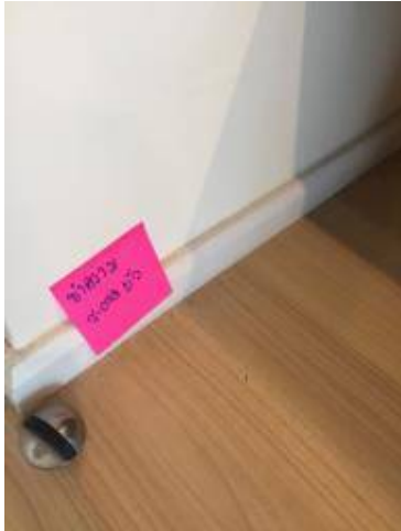
5 ทำความสะอาดบัวโดยรอบทั้งหมด