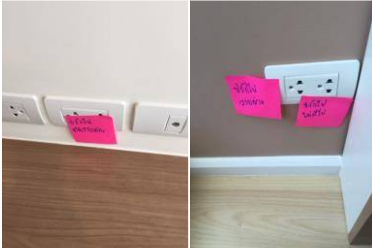
8 ปลั๊กไฟติดสลับด้าน+ปลั๊กไฟไม่มีไฟ