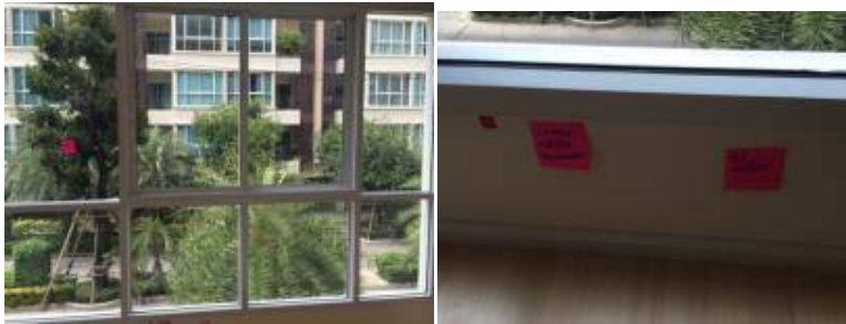
6 ทำความสะอาดกระจกหน้าต่าง+ทาสีผนัง+เก็บงานขอบลูนีเยมโดยรอบทั้งหมด+ขอบลูนีเยมประตูบานเลื่อน