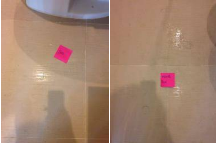
1 กระเบื้องโพรง1แผ่น+ยาแนวพื้นกระเบื้องใหม่ทั้งหมด