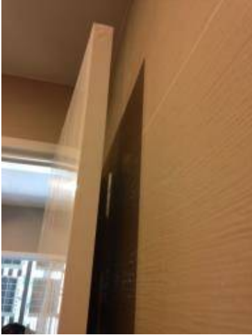
4. กั้นชนไม้ได้ติด