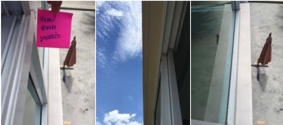
7 เก็บงานสีผนังด้านนอกรอยแตกร้าว