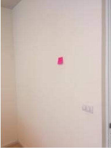
8ผนังเลอะทำความสะอาด