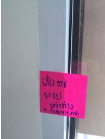
5 เก็บงานวงกบหน้าต่างทำความสะอาด