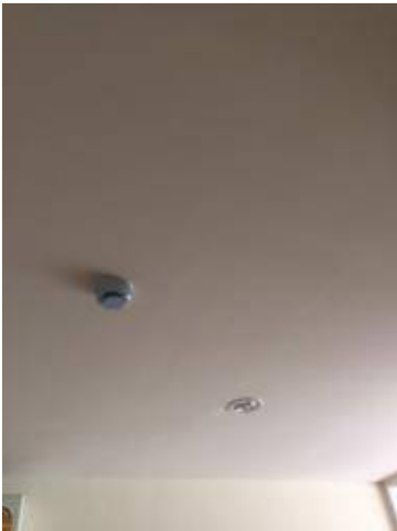
9เพดานฝ้า