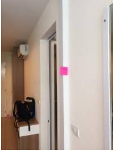
10 เก็บงานขอบกระจกอลูมิเนียม