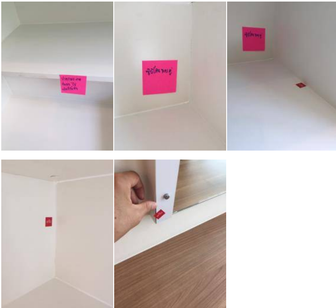
9 ทำความสะอาดชั้นวางทีวี+เก็บสลิ้นชัก+ซิลิโคนขอบตู้