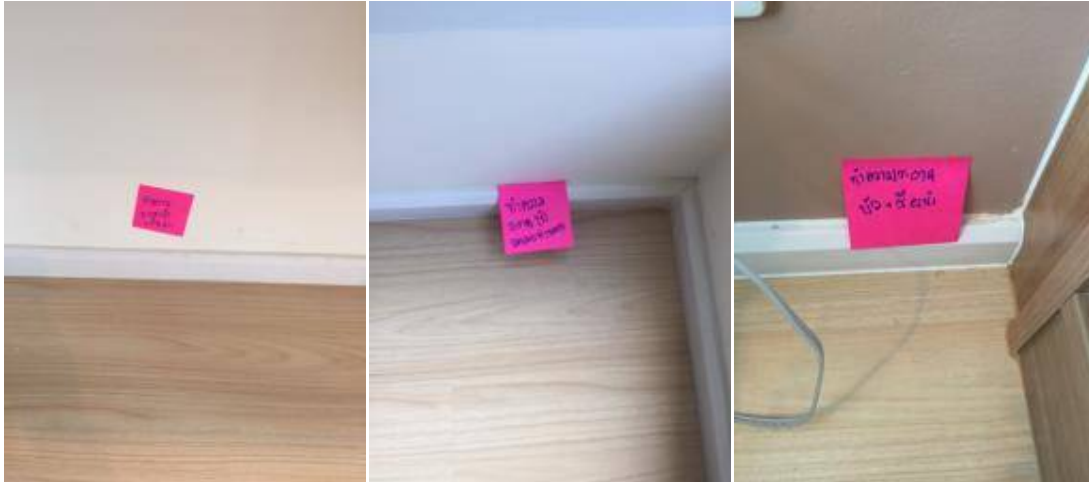
2ทำความสะอาดบัวโดยรอบทั้งหมด